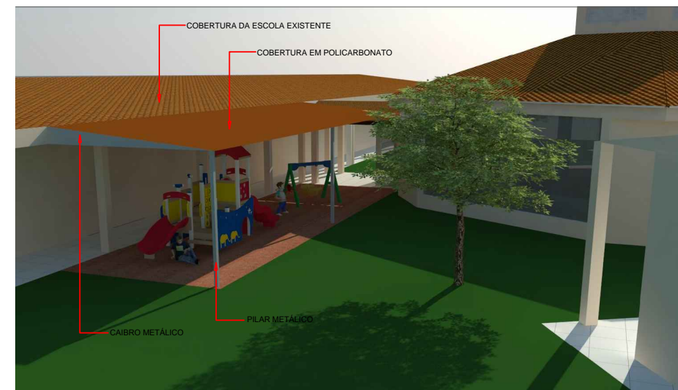
Vista Perspectiva (Fachada 02) Escala Visual