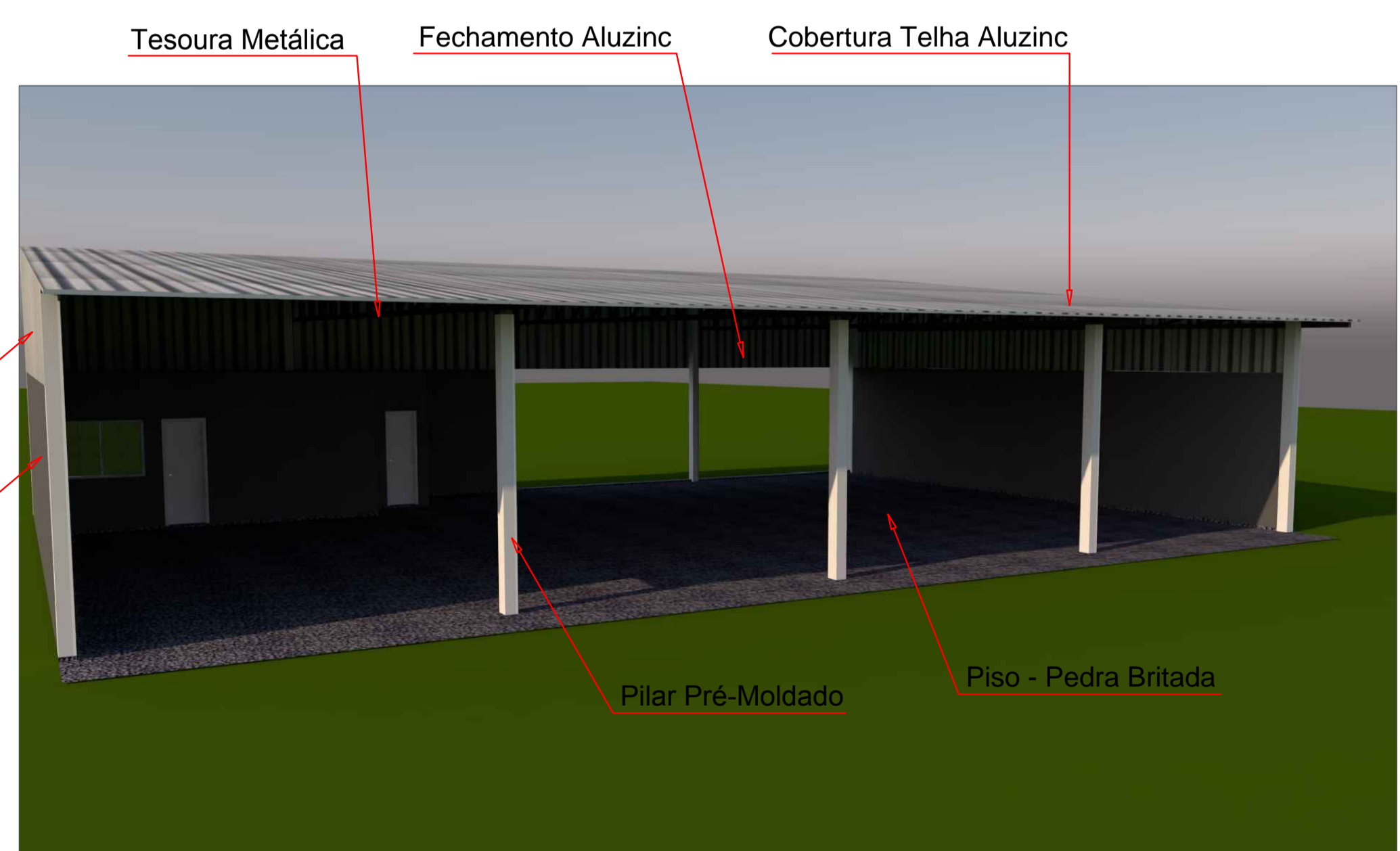
Vista Perspectiva (Fachada) Escala 1/100