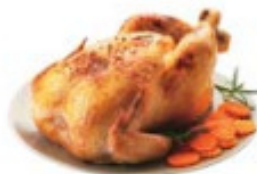
chicken and carrots