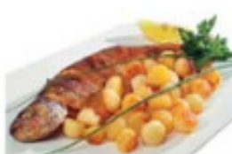
fish and potato