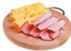
cheese and ham