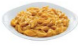
macaroni and cheese