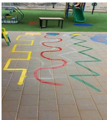
IMAGEM DO CIRCUITO

ATIVIDADE: FAZER O CIRCUITO NO SOLO COM FITA, GIZ, TINTA GUACHE, ALGUM MATERIAL QUE VOCÊS TENHAM EM CASA. EM SEGUIDA DESENVOLVER A ATIVIDADE CAMINHANDO CONFORME FOI FEITO NO SOLO, COMO MOSTRA A PRIMEIRA IMAGEM E PASSANDO ENTRE OS OBSTÁCULOS, COMO MOSTRA NA SEGUNDA IMAGEM.